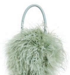
LOEFFLER RANDALL BAG, $464, SHOPBOP.COM