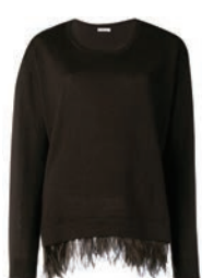
P.A.R.O.S.H. TOP, $514, FARFETCH.COM