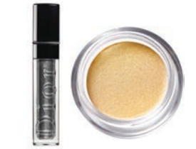
DIOR DIORSHOW LIQUID MONO IN SILVER FLAKES, $36, HUDSON'S BAY. MAYBELLINE NEW YORK EYESTUDIO COLOR-TATTOO 24HR CREAM GEL EYE SHADOW IN GOLDEN GIRL, $9, MAYBELLINE.CA

想嘗試當前流行閃效眼妝，節日絕對是最佳時機，但必須要保持真我。「潮流不能死跟，要根據自己的臉部特徵作出適當調整。例如妳是單眼皮，請不要畫上假雙眼皮。」Maybelline New York 加拿大首席化妝師 Grace 說道。她先為眼妝塗上基調眼影，「Colour Tattoo Cream Gel Eyeshadow 是她的心水「因為它不會脫妝。」下一步到畫眼線，使用眼線啫喱勾勒上下眼線，然後向外暈開。「之後再塗上眼影，與啫喱眼線融合。」Grace 說道：「完成煙薰效果之後，即塗上閃效或磨砂眼影，使用指腹將閃粉或顏色印上去。」