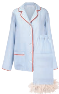
THE SLEEPER PYJAMAS, $351, THE-SLEEPER.COM