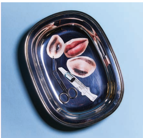
美容醫術指南 如何選擇激光、注射及煥膚療程 PAGE 8