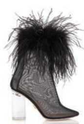
BROTHER VELLIES BOOTS, $1,589, BROTHERVELLIES.COM