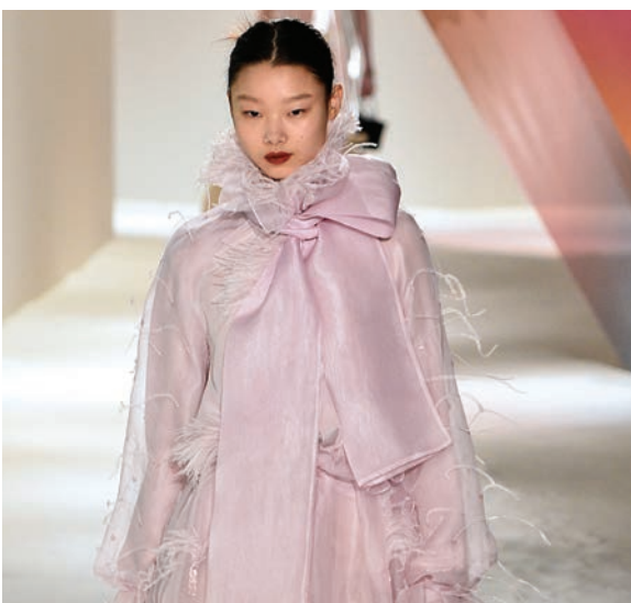
華麗羽毛 最夢幻裝飾背後的歷史 PAGE 4