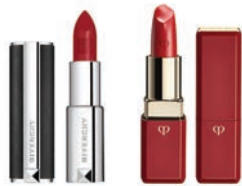
GIVENCHY ROUGE INTERDIT IN L'INTERDIT 333, $42, SEPHORA.CA. CLÉ DE PEAU LIPSTICK CASHMERE IN RED PASSION, $80, HOLT RENFREW