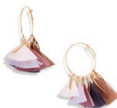
GAS BIJOUX EARRINGS, $324, NORDSTROM.COM