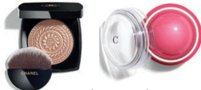
CHANEL ÉCLAT MAGNÉTIQUE DE CHANEL ILLUMINATING POWDER IN METAL PEACH, $85, CHANEL.COM. CHANTECAILLE AQUA BLUSH IN GLADIOLA, $44, NORDSTROM

清新的面孔和緋紅的臉頰於 2019 年秋季時裝天橋上特別顯眼（如 Chanel 和 Rosie Assoulin）。桃紅和粉紅是最為常見的顏色，適合任何膚色。但對於膚色較為蒼白的人來說，即使塗上最淺的顏色，依然感覺太強烈。解決方法：掃開。「使用軟毛刷，做到自然融合的效果。」Grace 建議。塗抹時，避免將腮紅集中在臉頰的蘋果肌上，而應將其抹開並延伸到耳朵。「如果看起來顏色太強，可以在上面塗上薄薄一層粉蜜，或者用海綿輕輕擦拭。」想加強喜慶感？最後，在顴骨位置掃上少許微亮閃閃粉即可。