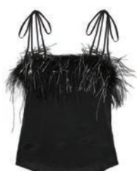
ALICE MCCALL TOP, $456, NET-A-PORTER.COM