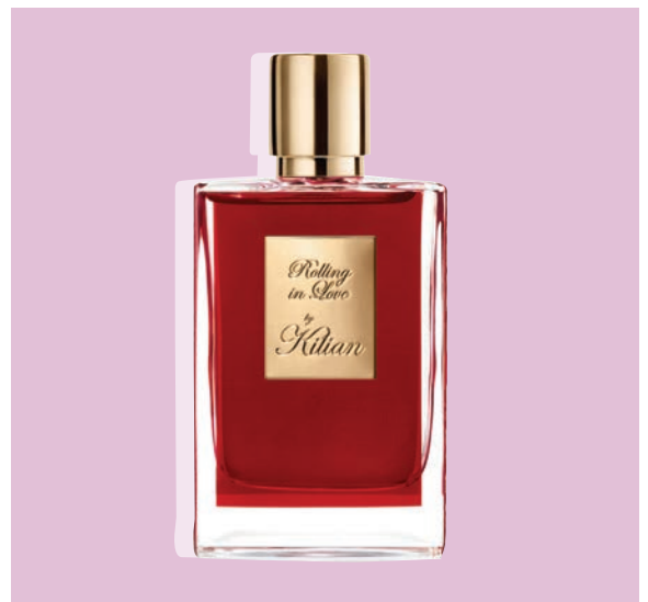
極致奢華香水 星級調香師教您品賞名貴的香味 PAGE 9