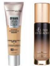
MAYBELLINE NEW YORK DREAM URBAN COVER, $12, MAYBELLINE.CA. VALMONT TEINT MAJESTUEUX FOUNDATION, $275, HOLT RENFREW